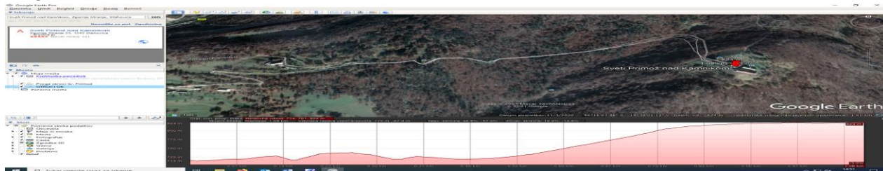
Graf: start: konec makadamske poti pri ovinku (Prelesje) – cilj: cerkvice Sv. Primož

Proga B: dolžina 1,10 km; višinska razlika 175 m.