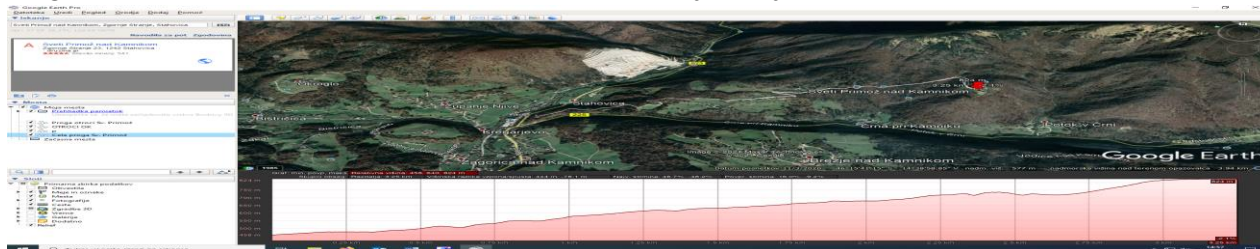
Graf: start: Vegrad – cilj: cerkvice Sv. Primož

Proga C: dolžina 3,5 km; višinska razlika 379 m. Čas teka je omejen na eno uro.